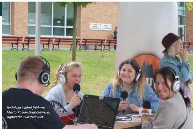
Redakcja i skład folderu: Marta Kazior-Grąbczewska, Agnieszka Iwaszkiewicz